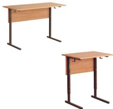
Стол ученический 1 или 2-х местный, нерегулируемый по высоте