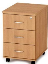
Тумба подкатная на 3(4) ящика

Материал кромки торцов: противоударная кромка ПВХ толщиной от 0,4 до 2 мм./гибкий накладной кант ПВХ/меламиновая кромка толщиной от 0,4 до 0,6 мм.