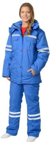
Одежда для сотрудников скорой помощи

Материалы: Тип применяемой ткани, некоторые элементы конструкции могут быть изменены по желанию заказчика.