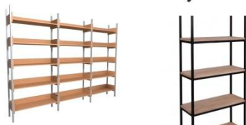
Стеллажи на металлокаркасе

Варианты покраски: порошковое покрытие; грунтовка; краска эмаль.