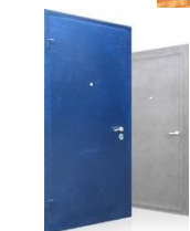
Двери металлические, сварные

Варианты покраски: порошковое покрытие; грунтовка; краска эмаль.