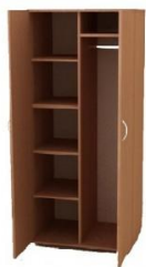
Шкаф для одежды комбинированный (со штангой и полкой)

Размер: Ш560/600хГ400хВ2100 Размер и конструктивные элементы изделия могут меняться Материалы корпуса: ЛДСП толщиной от 16 до 28 мм. Цветовая гамма, Фурнитура: на выбор заказчика Материал кромки торцов: противоударная кромка ПВХ толщиной от 0,4 до 2 мм./гибкий накладной кант ПВХ/меламиновая кромка толщиной от 0,4 до 0,6 мм. Материал задней стенки: ДВП/ ламинированное ДВП/ ЛДСП-16мм.