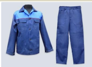
Костюм рабочий летний мужской (куртка и брюки)

Размер: Размерная сетка – согласно заявки заказчика. Пошив форменной и рабочей одежды с индивидуальной примеркой исключен при объеме партии более 5 единиц.