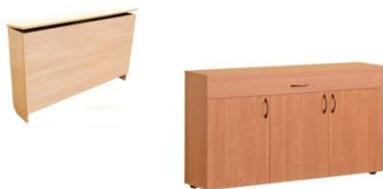
Тумба под школьную доску

Каркас: каркас и опоры стола выполнены из прямоугольной или круглой трубы (не изготавливаем из полуовальной трубы) с нанесением порошкового покрытия или обычной краски (нитро, ПФ)