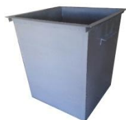
Мусорные контейнеры и прочие металлические баки

Варианты покраски: порошковое покрытие; грунтовка; краска эмаль.