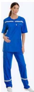
Одежда для сотрудников скорой помощи

Материалы: полиэфирное флуоресцентное трикотажное полотно желтого - HV «Yellow» или - «Orange» или флуоресцентной ткани «Сигнал» (100% полиэстер), плотностью 155 г/м2, с использованием световозвращающей ленты. Тип применяемой ткани, некоторые элементы конструкции могут быть изменены по желанию заказчика.