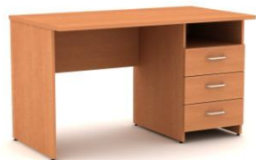
Стол письменный с выкатной/встроен- ной тумбой

Размер: Д1200хШ600хВ760 Размер и конструктивные элементы изделия могут меняться по желанию заказчика.