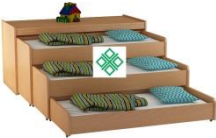
Кровать детская трехъярусная

Размер: 1480-2000x650-700x710 Размер и конструктивные элементы изделия могут меняться