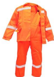
Костюм рабочий летний мужской (куртка и полукомбинезон)

Материалы: Хлопкополиэфирная ткань (полиэстер, 20-35% хлопок, плотность. 215гр/м2.) Тип применяемой ткани, некоторые элементы конструкции и расцветка могут быть изменены по желанию заказчика.