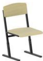
Стул ученический, нерегулируемый по высоте

Размер и конструктивные элементы изделия могут меняться по желанию заказчика