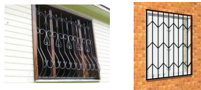
Решетки оконные кованные

Варианты покраски: порошковое покрытие; грунтовка; краска эмаль.