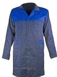
Халат рабочий мужской/женский

Материалы: Хлопкополиэфирная ткань(полиэстер, 20-35% хлопок, плотность. 215гр/м2.) Тип применяемой ткани, некоторые элементы конструкции и расцветка могут быть изменены по желанию заказчика.