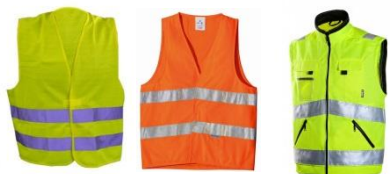
Жилеты сигнальные светоотражающие

Размер: Размерная сетка – согласно заявки заказчика.