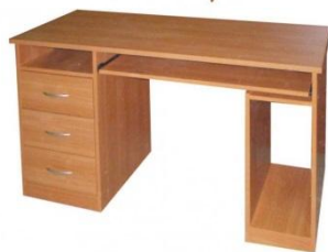
Стол компьютерный (офисный) с одной тумбой

Размер: Ш770/800хГ400хВ2100 Размер и конструктивные элементы изделия могут меняться Материалы корпуса: ЛДСП толщиной от 16 до 28 мм. Цветовая гамма, Фурнитура: на выбор заказчика Материал кромки торцов: противоударная кромка ПВХ толщиной от 0,4 до 2 мм./гибкий накладной кант ПВХ/меламиновая кромка толщиной от 0,4 до 0,6 мм. Материал задней стенки: ДВП/ ламинированное ДВП/ ЛДСП-16мм.