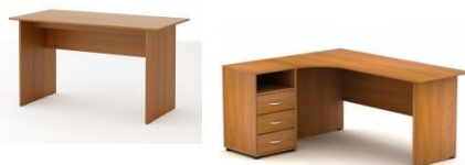
Стол письменный прямой/угловой

Материал кромки торцов: противоударная кромка ПВХ толщиной от 0,4 до 2 мм./гибкий накладной кант ПВХ/меламиновая кромка толщиной от 0,4 до 0,6 мм.