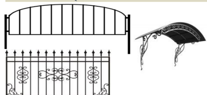
Газонные ограждения, заборные секции, козырьки

Металлоизделия (без возможности монтажа/установки на объекте заказчика) только изготовление. (не изготавливаем сейфы, металлические шкафы, противопожарные и прочие спецдвери)