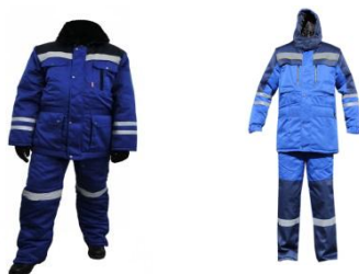
Костюм рабочий зимний мужской (куртка и полукомбинезон)

Материалы: Хлопкополиэфирная ткань(полиэстер, 20-35% хлопок, плотность. 215гр/м2.) Тип применяемой ткани, некоторые элементы конструкции и расцветка могут быть изменены по желанию заказчика.