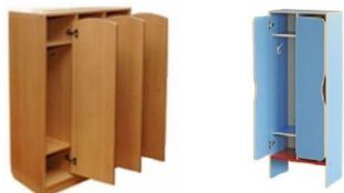
Шкафчики для детского сада

Размер: 1596x352x1350. Комплектуется в каждой секции одним крючком для одежды и полкой для головных уборов (полкой под обувь). Дверцы могут быть различной формой исполнения (закругления углов, фигурный вырез под ручку и прочие). Размер и конструктивные элементы изделия могут меняться.