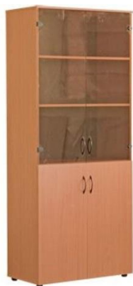
Шкаф для документов со стеклянными дверцами

Материал задней стенки: ДВП/ ламинированное ДВП/ ЛДСП-16мм.