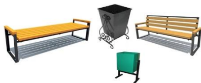
Скамейки парковые, урны

Варианты покраски: порошковое покрытие; грунтовка; краска эмаль.