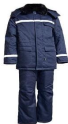
Костюм рабочий зимний мужской (куртка и брюки)

Материалы: Хлопкополиэфирная ткань(полиэстер, 20-35% хлопок, плотность. 215гр/м2.) Тип применяемой ткани, некоторые элементы конструкции и расцветка могут быть изменены по желанию заказчика.